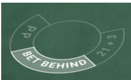
Ajutor de joc Live Blackjack 13

Jucătorii care joacă cu pariul principal pe loc vor lua deciziile cu privire la mână. Pentru a juca pariul din spate pe orice jucător, plasați-vă pariurile în perioada de pariere în zona special alocată a casetei acestuia, marcată cu „ Pariu din spate ”.